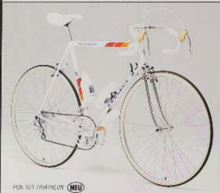
PGN 10-T TRIATHLON NEU