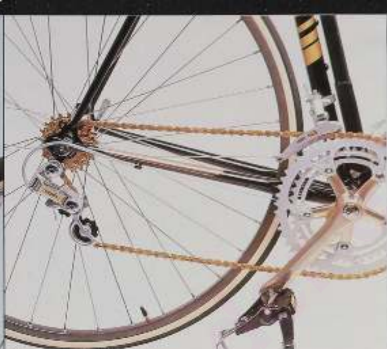
Antrieb des Modells PGN 10 GS