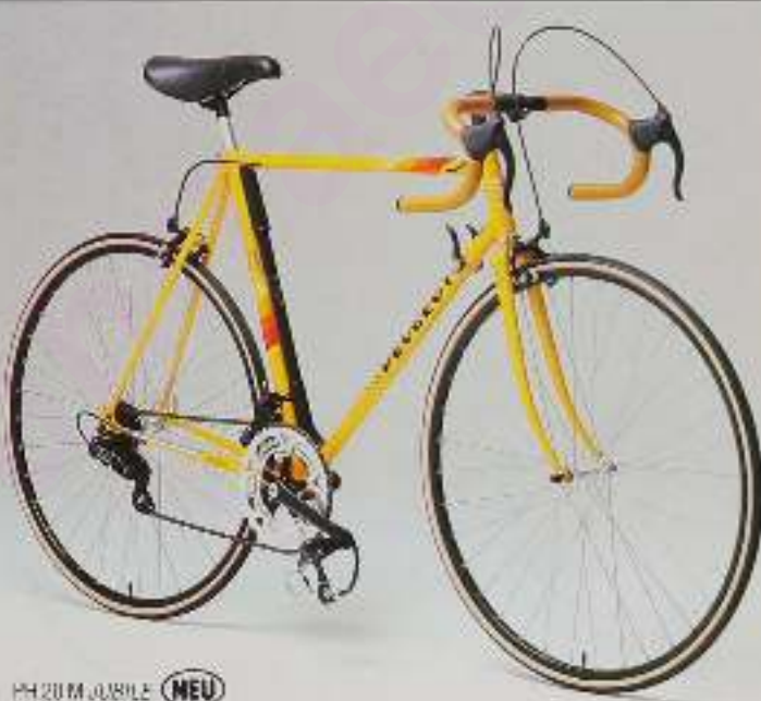
PH 20 M JUBILE NEU