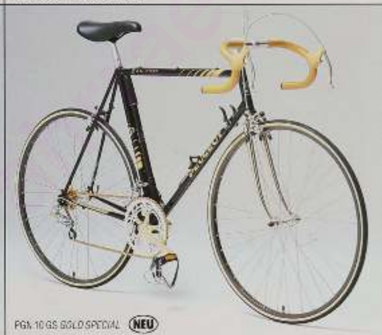
PGN 10 GS GOLD SPECIAL NEU