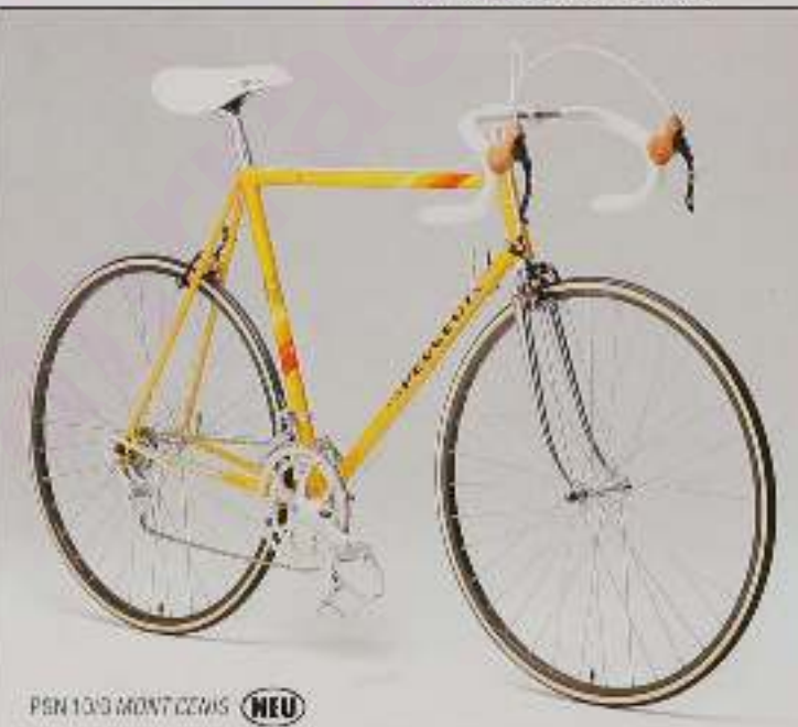
PSN 10/B MONT CENIS NEU