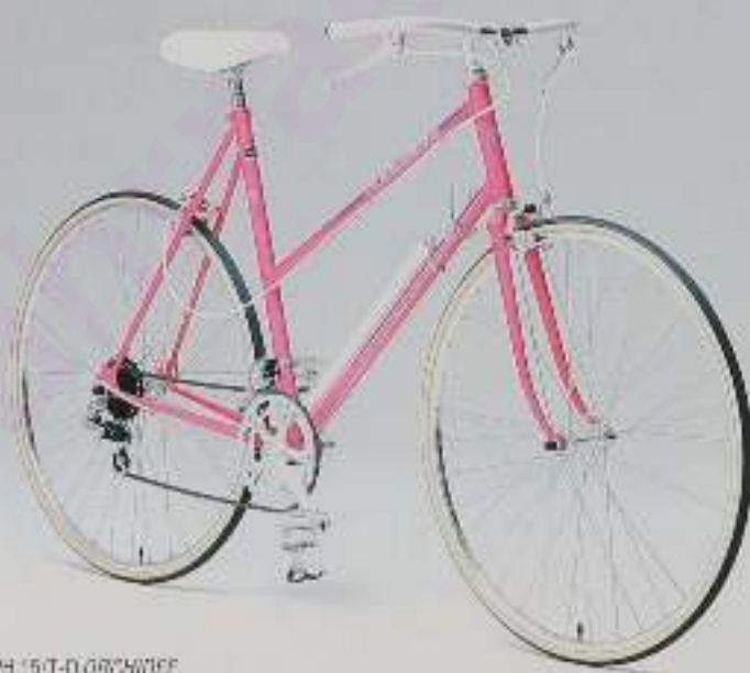
PH 15/T-D ORCHIDEE