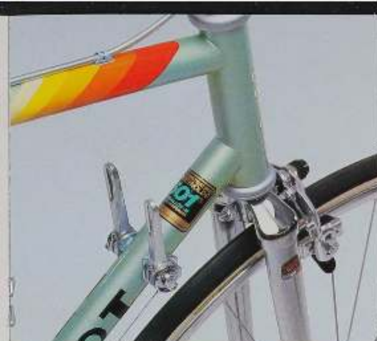
Steuersatz mit REYNOLDS 501-Folien