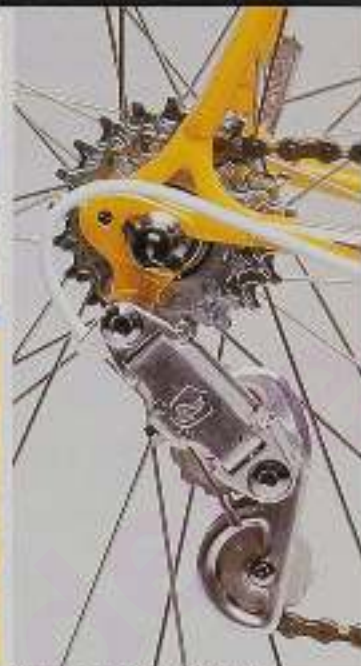
Schaltung des Modells PSN 10/B