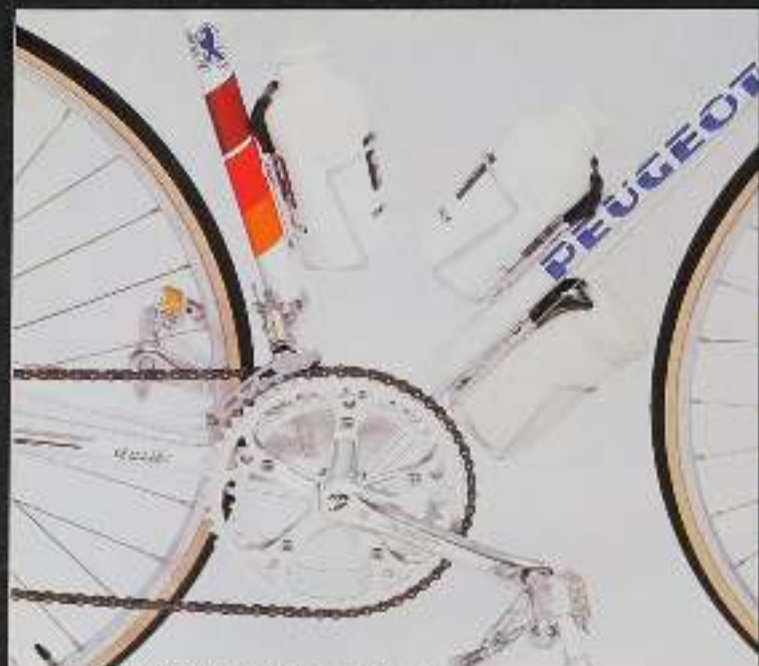
PGN 10-TRIATHLON - Ausstattung und Sonderzubehör